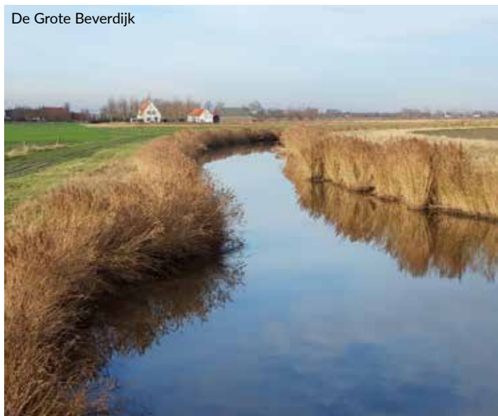
De Grote Beverdijk