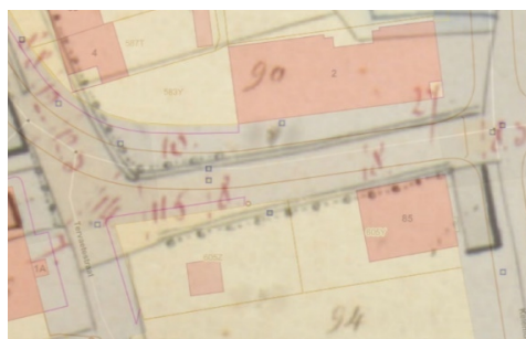
Figuur 3: combinatie figuur 1 en figuur 2, Geopunt

Uit de figuren 1 tot en met 3 kan worden afgeleid dat de Tervaetstraat niet enkel ter hoogte van de projectzone een aberratie vertoont met chemin nr. 10 uit de atlasweg der buurtwegen. Zo lijkt ook een aberratie te bestaan ter hoogte van de woningen Tervaetstraat 4-4C (ten noorden van onderhavige projectzone). In elk geval heeft deze verplaatsing/aberratie geen impact op het mogelijk gebruik van de weg. De wegbedding werd evenmin versmald. In alle redelijkheid kan geoordeeld worden dat, de structuur en de samenhang en de toegankelijkheid van de gemeentewegen door deze vastgestelde afwijking/aberratie niet in het gedrang komen. Gezien de afwijkingen in de zelfde zin en van de zelfde grootteorde op meerdere plaatsen langsheen het tracé van de Tervaetstraat/chemin nr. 10 geobserveerd kunnen worden en gelet op voormelde beoordeling aangaande de algemene doelstellingen van het gemeentewegendecreet, wordt geoordeeld dat de verplaatsing van de gemeenteweg de realisatie van de algemene doelstellingen uit het gemeentewegendecreet niet schaadt en zich daartoe op neutrale wijze verhouden.