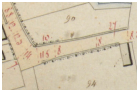
Figuur 2: Uittreksel Atlas der buurtwegen (1841)