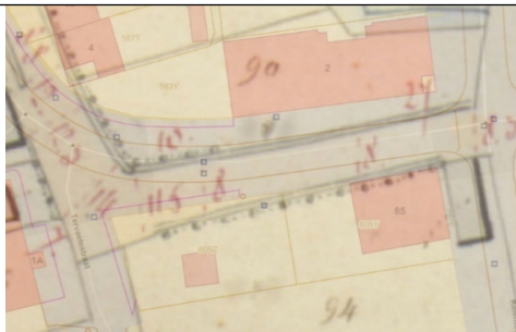
Figuur 3: combinatie figuur 1 en figuur 2, Geopunt

Uit de figuren 1 tot en met 3 kan worden afgeleid dat de Tervaetestraat niet enkel ter hoogte van de projectzone een aberratie vertoont met chemin nr. 10 uit de atlasweg der buurtwegen. Zo lijkt ook een aberratie te bestaan ter hoogte van de woningen Tervaetestraat 4-4C (ten noorden van onderhavige projectzone). In elk geval heeft deze verplaatsing/aberratie geen impact op het mogelijk gebruik van de weg. De wegbedding werd evenmin versmald. In alle redelijkheid kan geoordeeld worden dat, de structuur en de samenhang en de toegankelijkheid van de gemeentewegen door deze vastgestelde afwijking/aberratie niet in het gedrang komen. Gezien de afwijkingen in de zelfde zin en van de zelfde grootteorde op meerdere plaatsen langsheen het tracé van de Tervaetestraat/chemin nr. 10 geobserveerd kunnen worden en gelet op voormelde beoordeling aangaande de algemene doelstellingen van het gemeentewegendecreet, wordt geoordeeld dat de verplaatsing van de gemeenteweg de realisatie van de algemene doelstellingen uit het gemeentewegendecreet niet schaadt en zich daartoe op neutrale wijze verhouden.